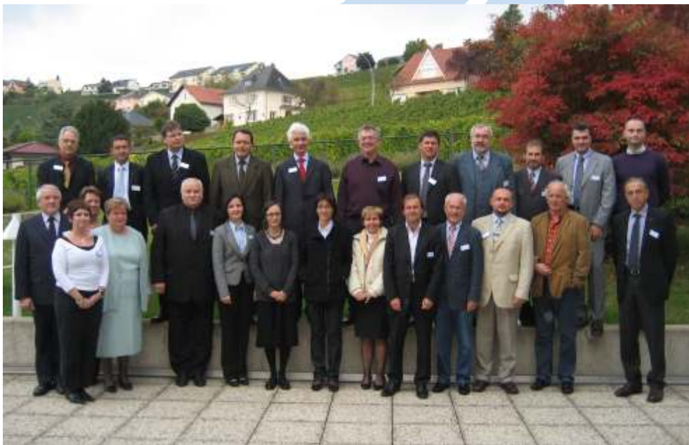
réunion du Conseil d'Administration, le 3/4 octobre 2008 à Remich (Luxembourg)

Ceci est la 13 ème édition du papier électronique de l'E.D.E. : E.D.E. VISION. Ce document vous informera sur les développements actuels des établissements de soins de longue durée en Europe et tout particulièrement sur la situation des directrices et directeurs. L'E.D.E. essaiera d'adopter une position réaliste dans les solutions européennes en ce qui concerne le secteur d'aide aux personnes âgées. Le premier but d'E.D.E. Vision est de vous informer sur les projets de l'E.D.E. et de ses pays membres.