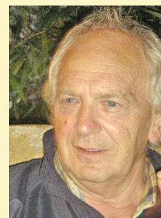
Rédaction: Wim Schepers