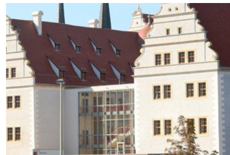
Le château d'Osterstein

peens ont reçu les exposés et les concepts en souvenir sur une clé USB. Le dernier jour fut consacré à la visite du château d'Osterstein à Zwickau, une maison de retraite médicalisée de la Senioren-und Seniorenpflegeheim gGmbH Zwickau.