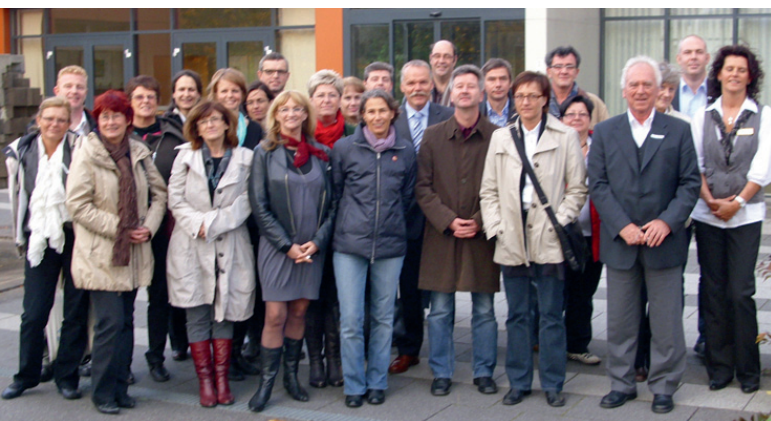
Les participants au voyage d'étude

Vingt neuf membres de notre association ont visité début novembre plusieurs structures d'accueil aux personnes âgées. L'idée de ce voyage d'étude était de favoriser les échanges entre les pays ainsi que le transfert d'expériences et de savoir dans le but d'apprendre les uns