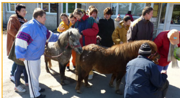
Les poneys sont à la fois des amis et des sources de distraction pour les résidents de « Ruja ».